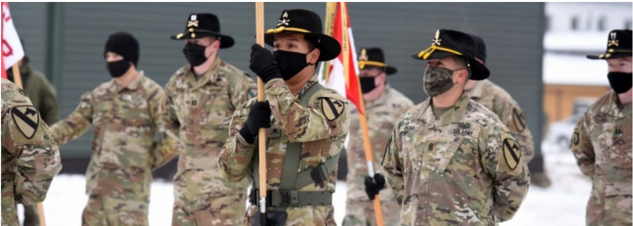
US-Soldaten vom 2nd Cavalry Battalion des 8th Cavalry Regiment in Litauen

Das 2nd Battalion des 8th Cavalry Regiment wurde (im Rahmen der Operation Atlantic Resolve, s. https://de.wikipedia.org/wiki/Operation_Atlantic_Resolve ) mit schweren Waffen – darunter Abrams-Kampfpanzer und Bradley-Schützenpanzer – nach Litauen verlegt.